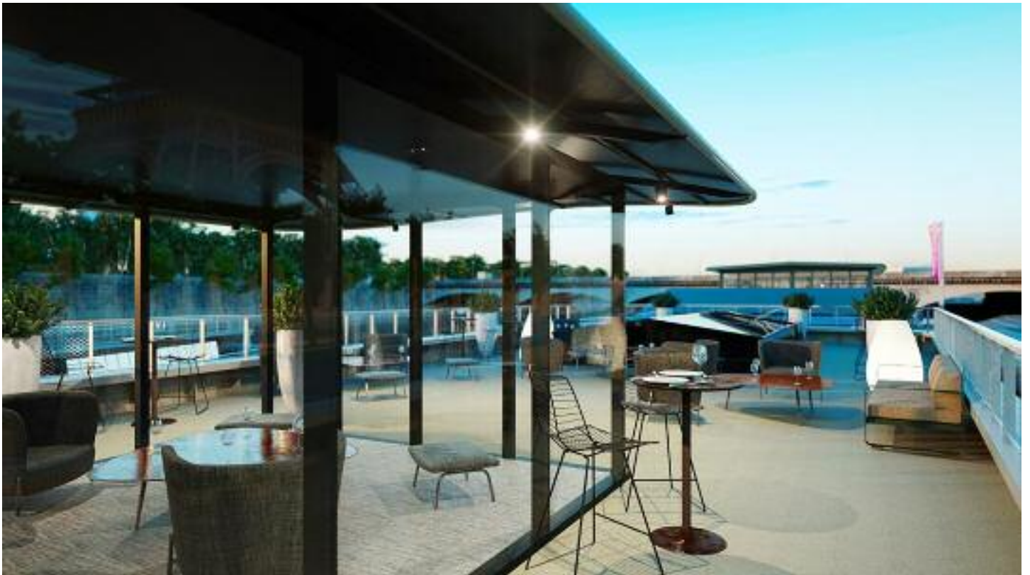
Pont supérieur (rooftop) / Upper deck (rooftop)

Repas assis / Seated meal: 125 Cocktail / Cocktail : 200 Séminaire théâtre / Workshop theater : 90