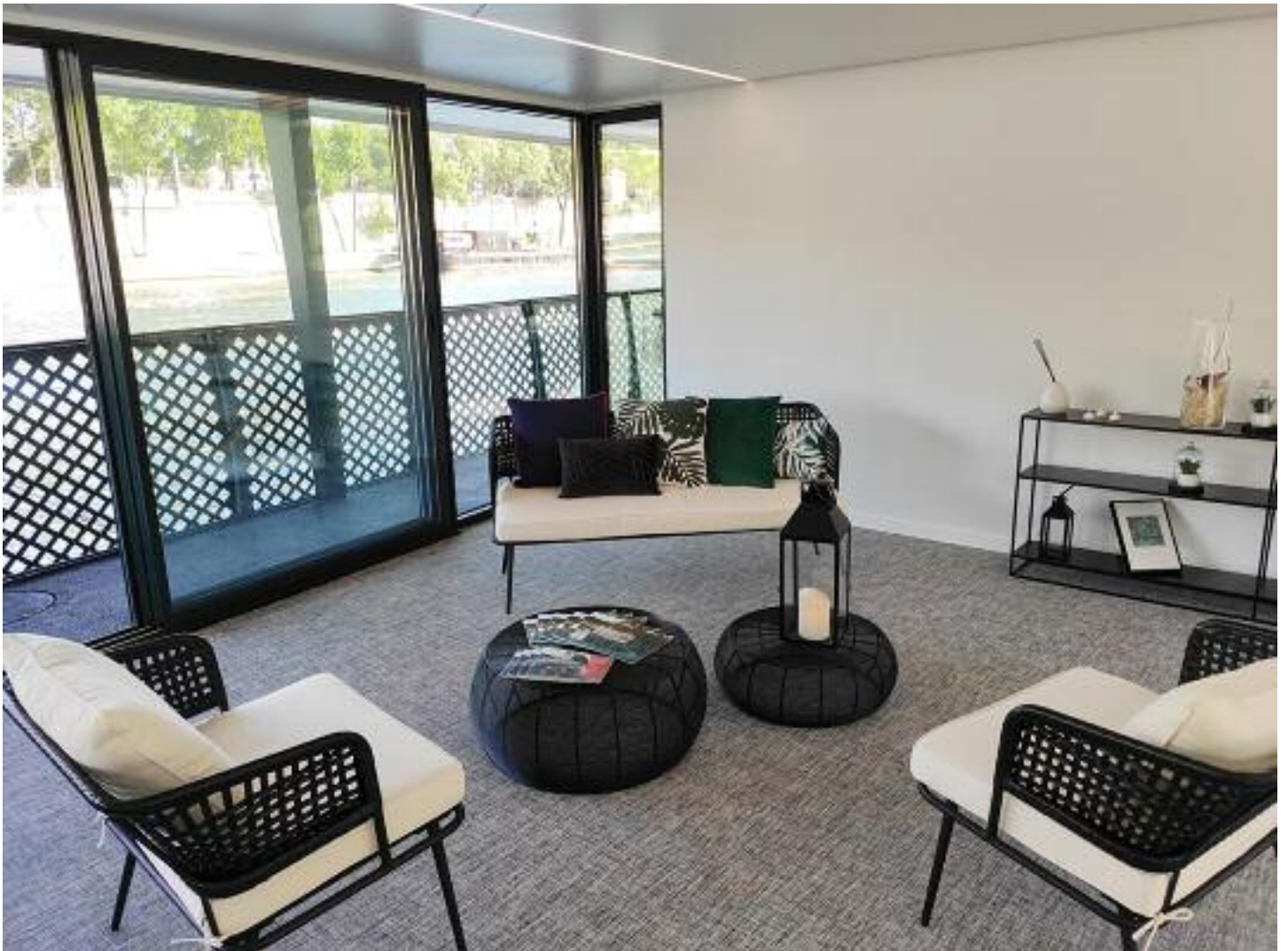
Salon du pont principal / Main deck lounge