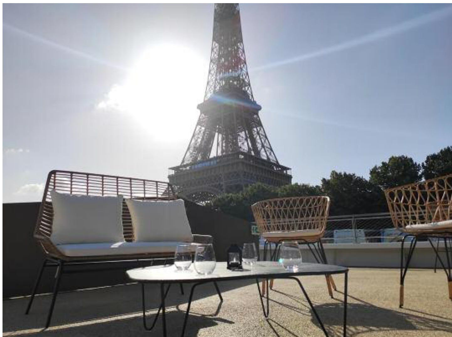
Pont supérieur (rooftop) / Upper deck (rooftop)

Repas assis / Seated meal: 125 Cocktail / Cocktail : 200 Séminaire théâtre / Workshop theater : 90