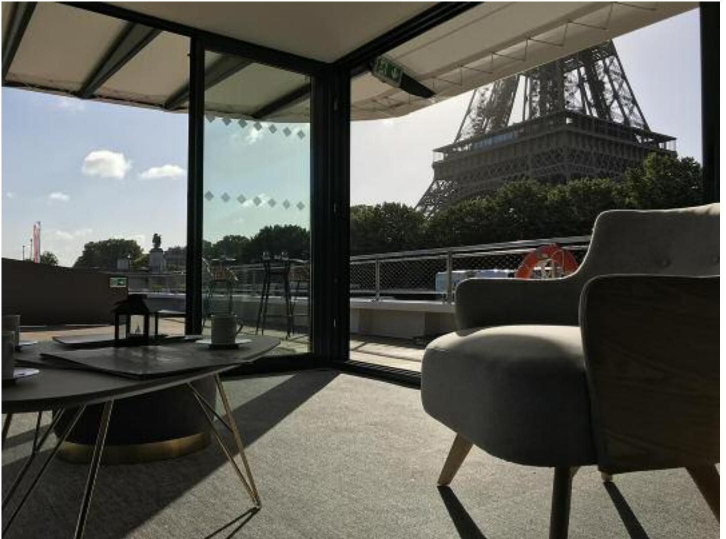
Vue du salon VIP du pont supérieur (rooftop) / View from the VIP lounge upper deck (rooftop)

Repas assis / Seated meal: 125 Cocktail / Cocktail : 200 Séminaire théâtre / Workshop theater : 90