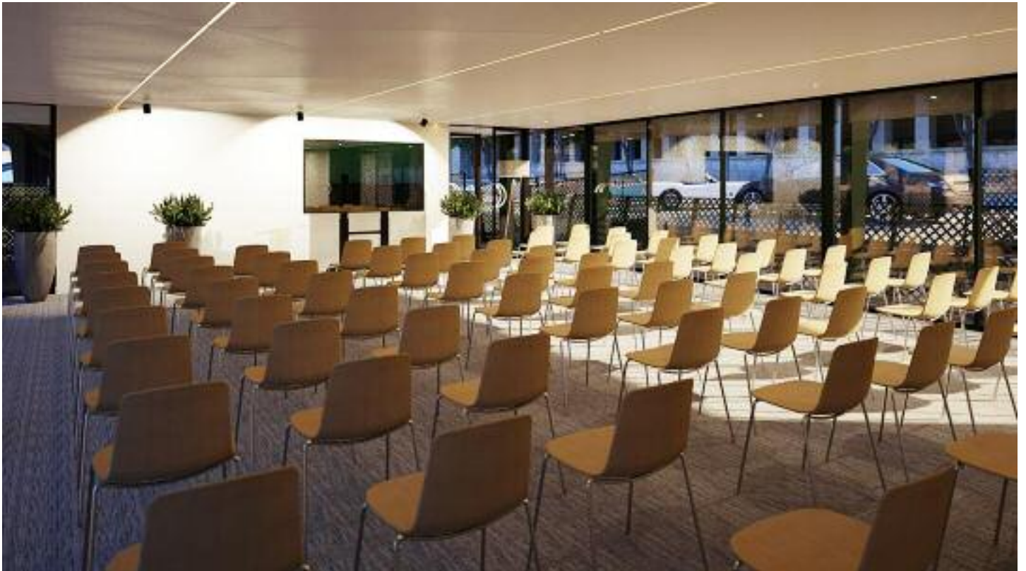
Salon du pont principal en théâtre / Main deck lounge for a workshop

Repas assis / Seated meal: 125 Cocktail / Cocktail : 200 Séminaire théâtre / Workshop theater : 90