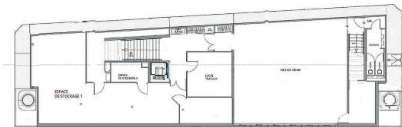
Plan pont inférieur / Lower deck floorplan