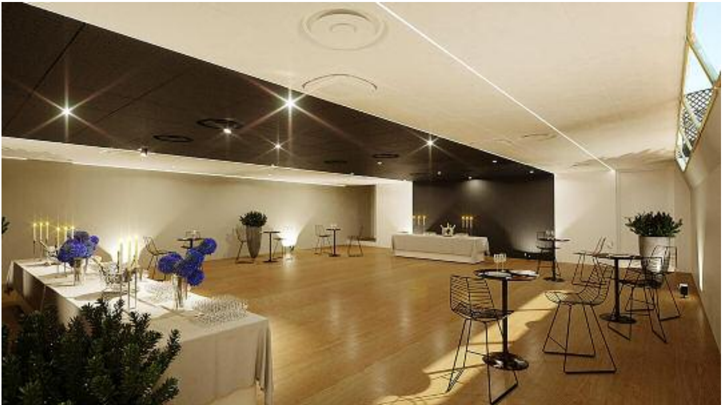
Salon pont inférieur en mode cocktail / Lower deck lounge in cocktail mode

Repas assis / Seated meal: 125 Cocktail / Cocktail : 200 Séminaire théâtre / Workshop theater : 90