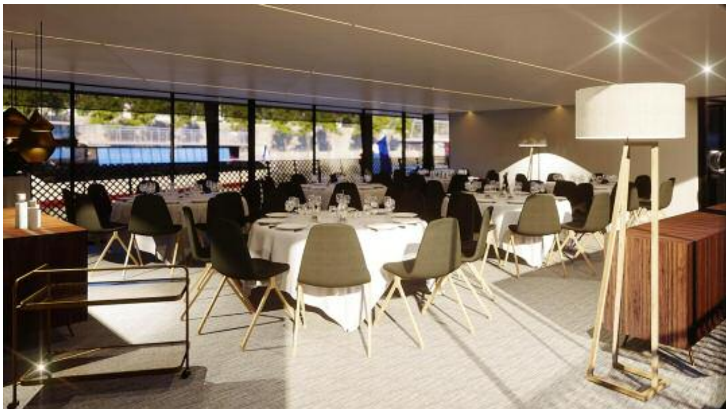
Salon du pont principal en repas assis / Main deck lounge in seated meal

Repas assis / Seated meal: 125 Cocktail / Cocktail : 200 Séminaire théâtre / Workshop theater : 90