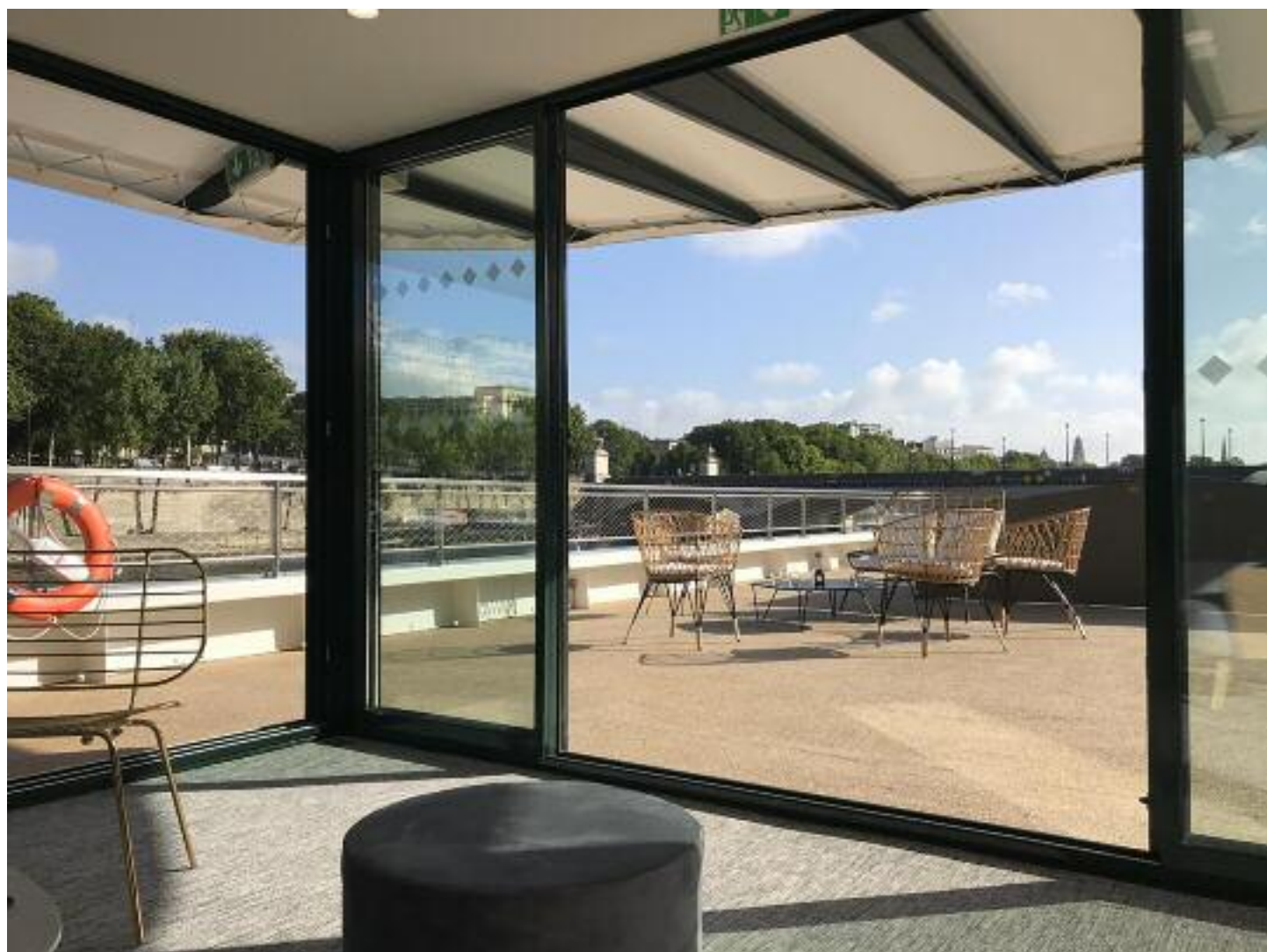
Vue du salon VIP du pont supérieur (rooftop) / View from the VIP lounge upper deck (rooftop)