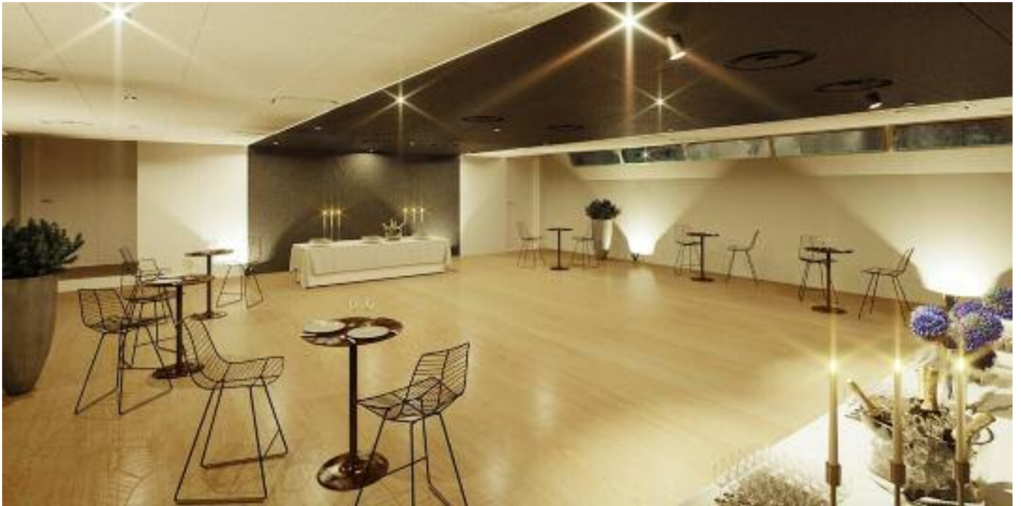
Salon pont inférieur en mode cocktail / Lower deck lounge in cocktail mode

Repas assis / Seated meal: 125 Cocktail / Cocktail : 200 Séminaire théâtre / Workshop theater : 90