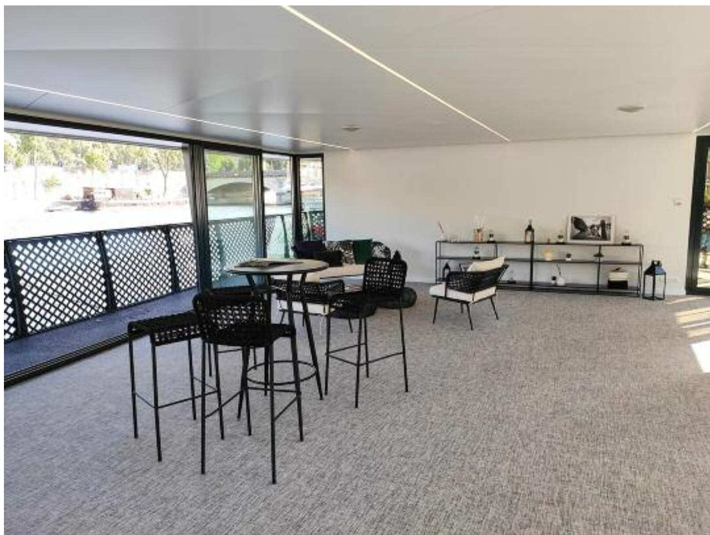
Salon du pont principal / Main deck lounge