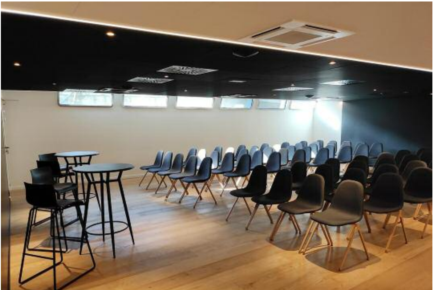
Salon pont inférieur en théâtre / Lower deck lounge for a workshop

Repas assis / Seated meal: 125 Cocktail / Cocktail : 200 Séminaire théâtre / Workshop theater : 90